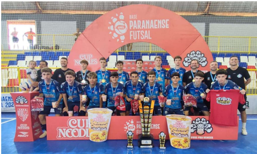
SUB 15 CAMPEÃO PARANAENSE 2015