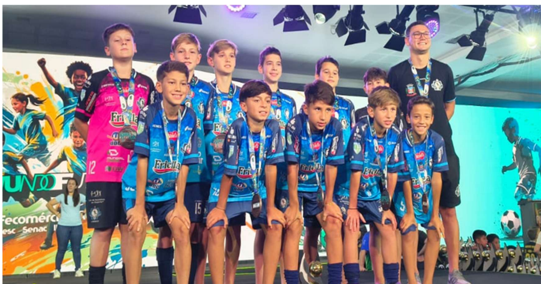
3º LUGAR NA COPA MUNDO DO FUTSAL 2025