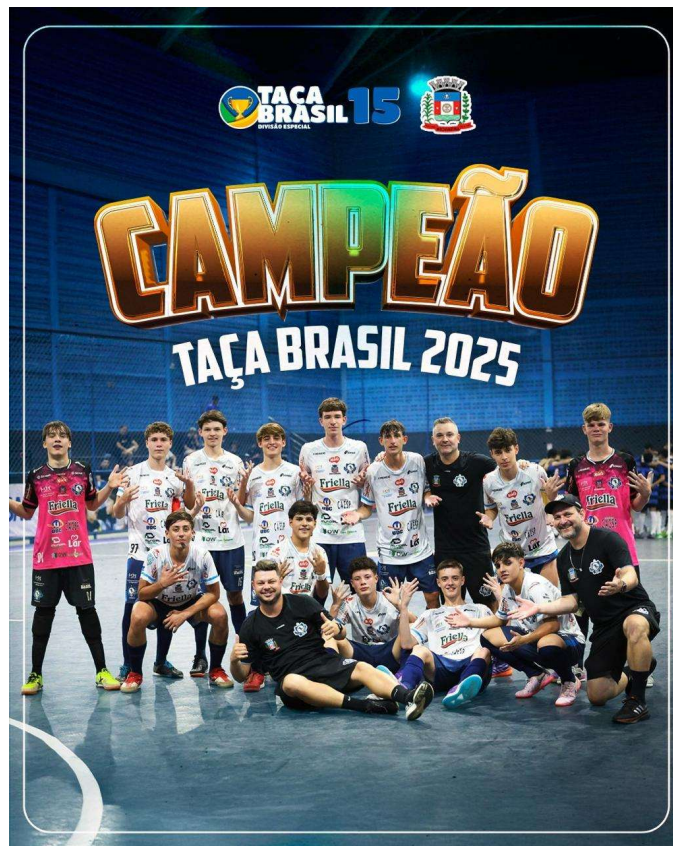
CAMPEÃO DA TAÇA BRASIL SUB 15 EM 2025