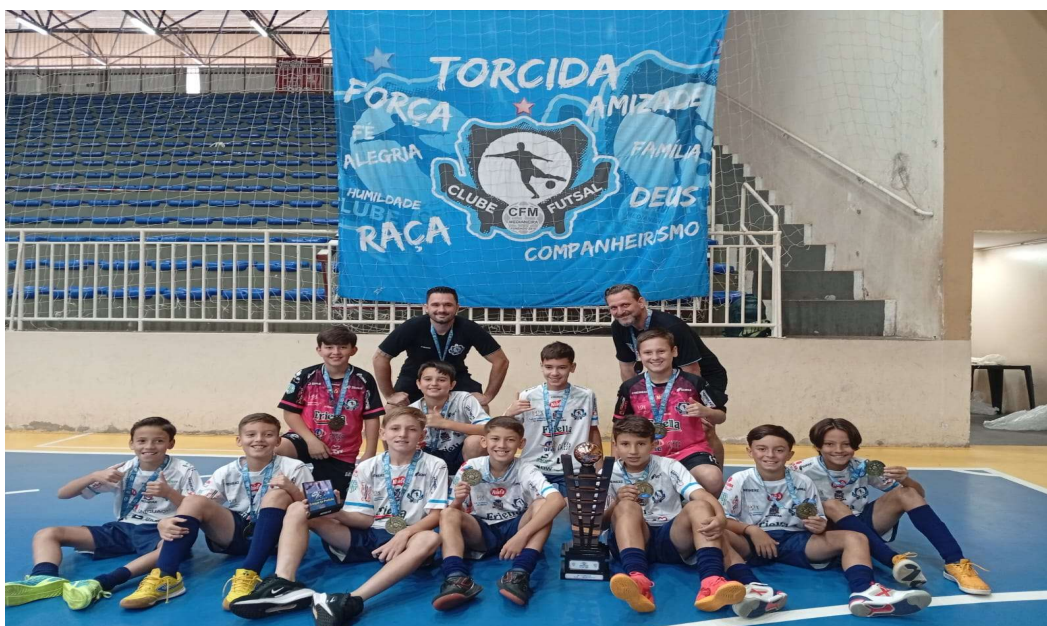
3º LUGAR CAMPEONATO PARANAENSE