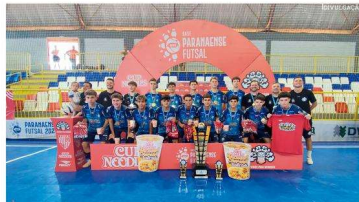
Medianeira sagrou-se tricampeã Paranaense de Futsal Sub-15 neste final de semana

O Medianeira Futsal sagrou-se Campeã Paranaense de Futsal Sub-15, no último final de semana. A fase final da competição foi realizada em Medianeira, no Ginásio Municipal Antônio Lacerda Braga, de 05 a 07 de dezembro.