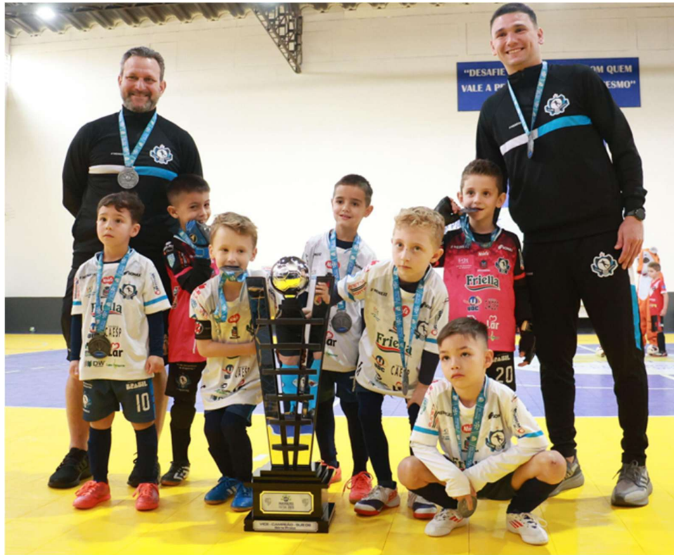
VICE-CAMPEÃO PARANAENSE SUB 06 SÉRIE PRATA