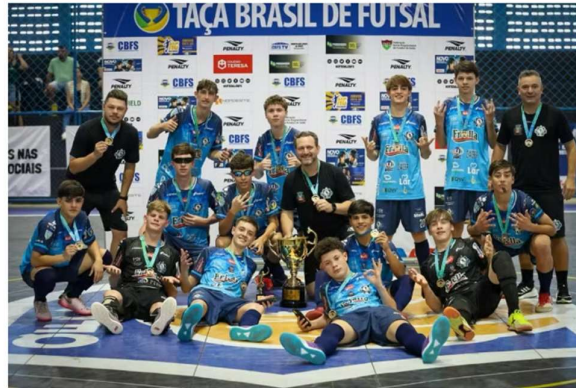
Medianeira conquista a Taça Brasil de Futsal Sub-15